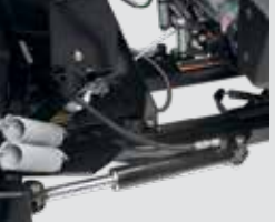
Doppelt wirkende Hydraulikzylinder