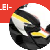
Heritage White IV