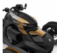
Fiebre del oro