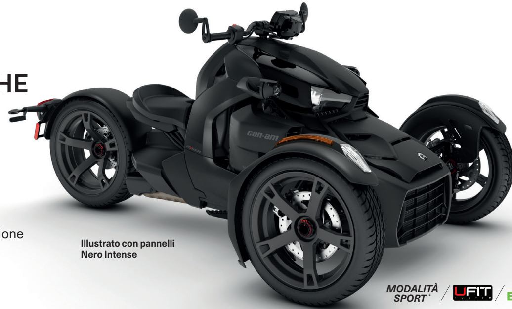
Illustrato con pannelli Nero Intense