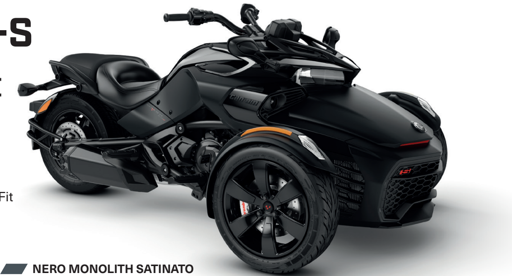
NERO MONOLITH SATINATO