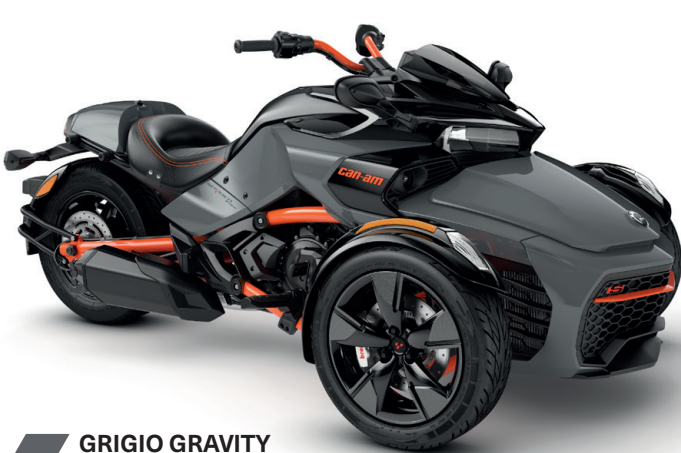
GRIGIO GRAVITY SERIE SPECIAL