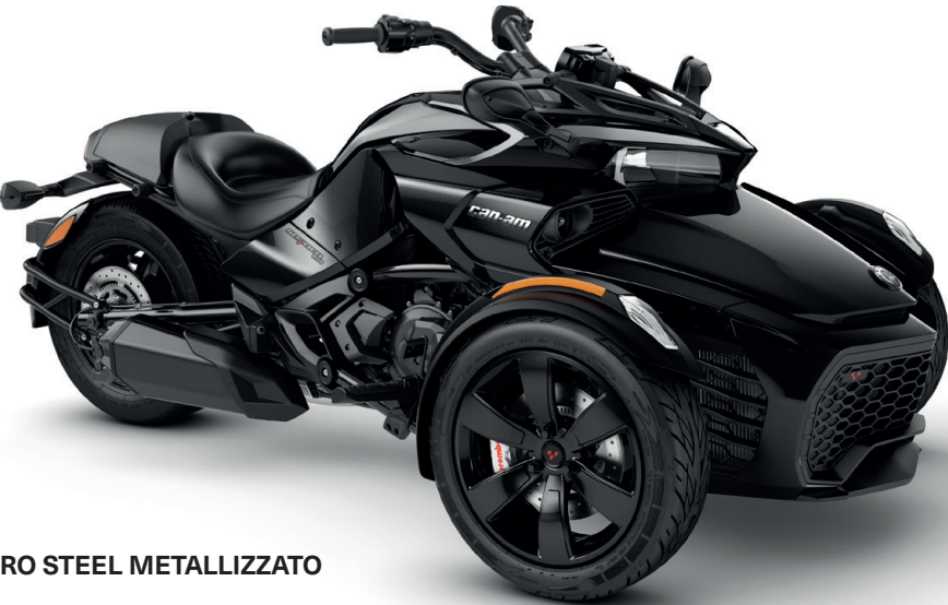
NERO STEEL METALLIZZATO