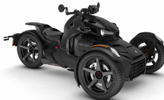
CAN-AM RYKER SPORT 000F5PB00

Tutte le caratteristiche standard di Ryker con Rotax 900 cc, più: