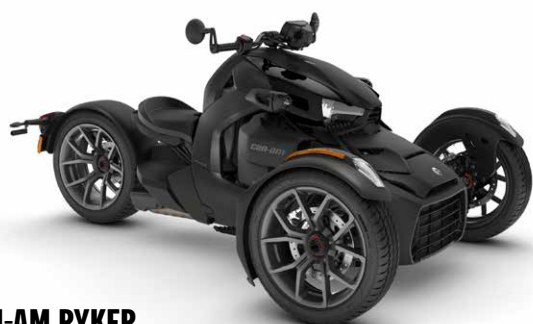
CAN-AM RYKER 000F2PB00

Tutte le caratteristiche standard di Ryker con Rotax 600 cc, più: