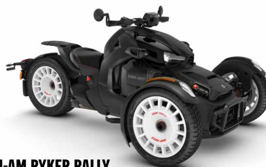
CAN-AM RYKER RALLY 000F3PB00

Tutte le caratteristiche standard di Ryker con Rotax 900 cc, più: