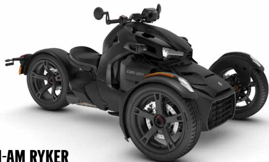
CAN-AM RYKER 000F1PB00