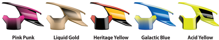
Pink Punk Liquid Gold Heritage Yellow Galactic Blue Acid Yellow