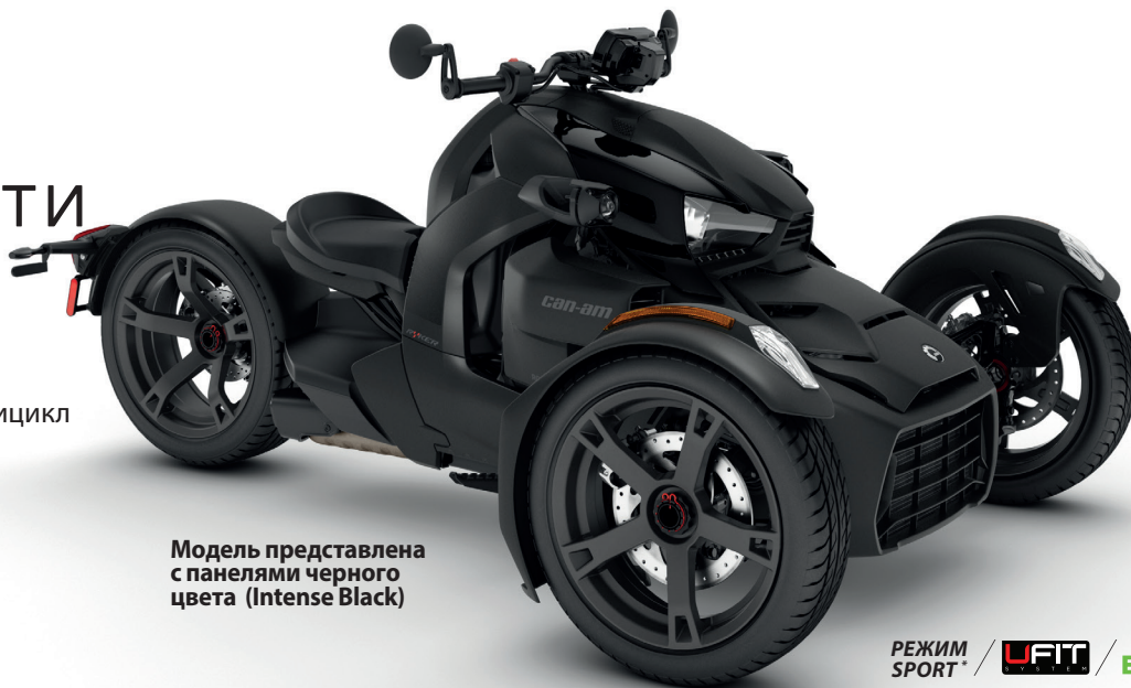
Модель представлена с панелями черного цвета (Intense Black)