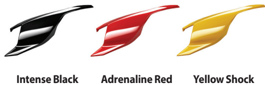
Intense Black Adrenaline Red Yellow Shock