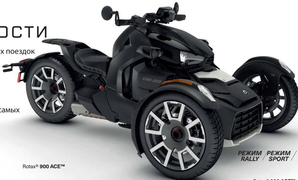
Rotax® 900 ACE™