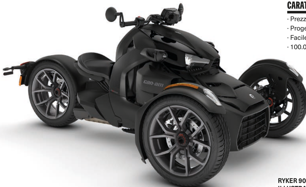
RYKER 900 ILLUSTRATO CON PANNELLI NERO INTENSE