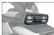
1 Protezioni per fari (219401171)