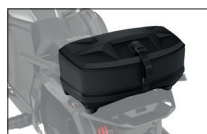
5 Borsa sportiva LinQ (860202447)

Scegliete tra più di 40 possibili accessori per soddisfare tutte le vostre esigenze per la vostra prossima avventura! L'integrazione del sistema LinQ con i punti di ancoraggio LinQ Nano, LinQ Lite e LinQ 16" garantisce un'accessorizzazione facile, versatile e robusta del Can-Am Canyon.