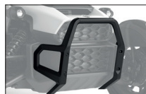
3 Paraurti anteriore Adventure (219401193)