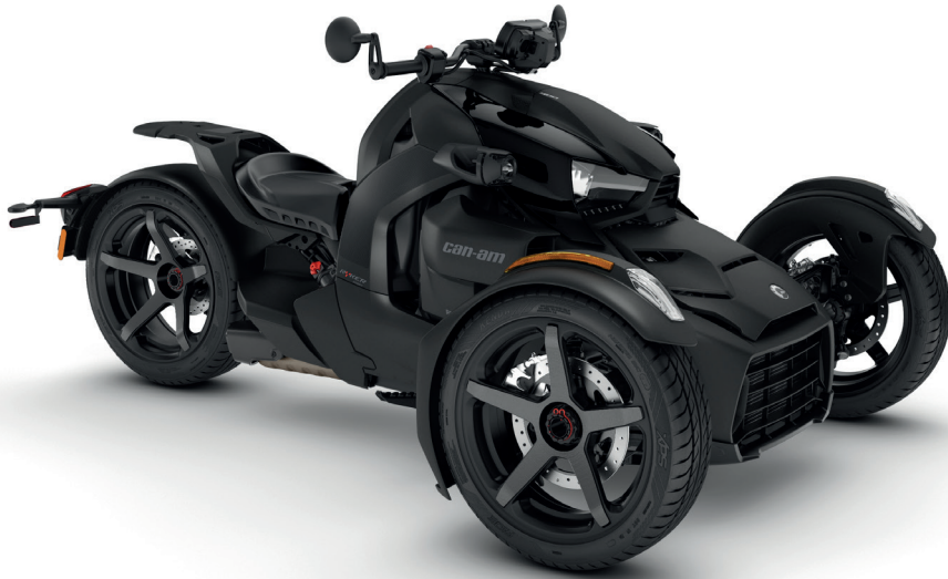
Rotax® 900 ACE™