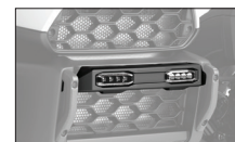
1 Luces antiniebla LED (219401192)

¡Selecciona entre más de 35 accesorios posibles para adaptar a tus necesidades tu próxima aventura! La integración del sistema LinQ con los puntos de anclaje LinQ Nano, LinQ Lite y LinQ 16" permite una personalización fácil, versátil y sólida de la Can-Am Canyon.