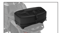
6 Bolsa deportiva LinQ (860202447)