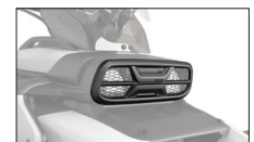
2 Protector de faros (219401171)