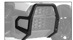
4 Defensa delantera Adventure (219401193)