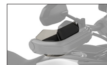
3 Deflectores de manos (219401186)