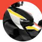
Blanc Héritage IV