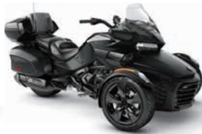
NOIR MONOLITHE SATIN NOIRE*