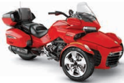
ROUGE PLASMA CHROME*