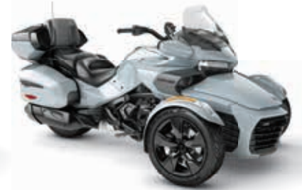
BLEU GLACIAL MÉTALLIQUE NOIRE*