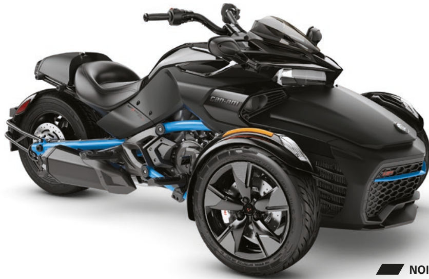
NOIR MONOLITHE SATIN