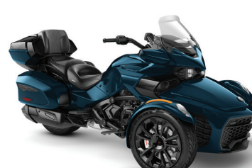
■ PÉTROLE MÉTALLIQUE NOIR*