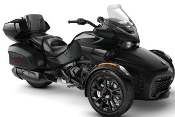
■ NOIR MONOLITHE SATIN NOIR*