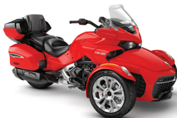
■ ROUGE PLASMA PLATINE*