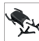
5 Passagierszadel (219401216)