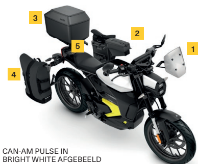
CAN-AM PULSE IN BRIGHT WHITE AFGEBEELD