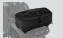
5 Sac de sport LinQ (860202447)

Choisissez parmi plus de 35 accessoires offerts pour répondre à tous vos besoins lors votre prochaine aventure! L'intégration du système LinQ avec les points d'ancrage LinQ Nano, LinQ Lite et LinQ 16po permet une accessoirisation facile, polyvalente et robuste du Can-Am Canyon.