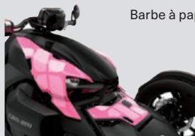
Barbe à papa