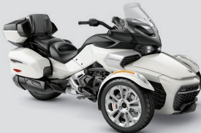
Spyder F3 Limited blanc perlé montré