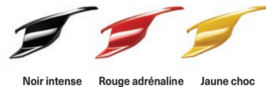
Noir intense Rouge adrénaline Jaune choc