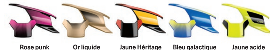
Rose punk Or liquide Jaune Héritage Bleu galactique Jaune acide