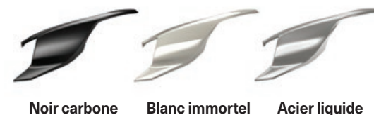
Noir carbone Blanc immortel Acier liquide