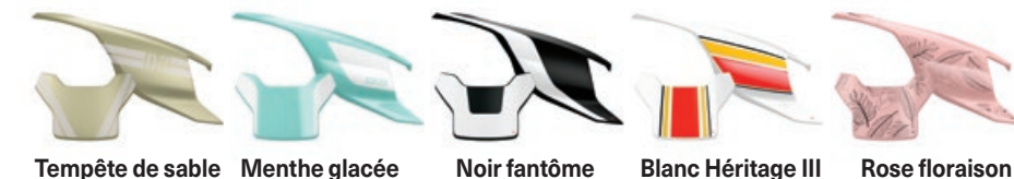
Tempête de sable Menthe glacée Noir fantôme Blanc Héritage III Rose floraison