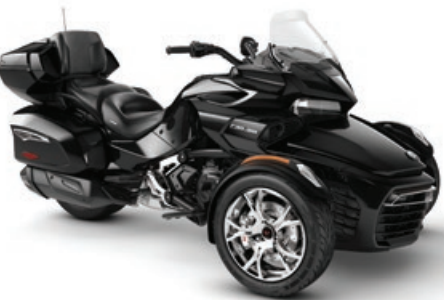
NOIR ACIER MÉTALLIQUE* ÉDITION CHROME