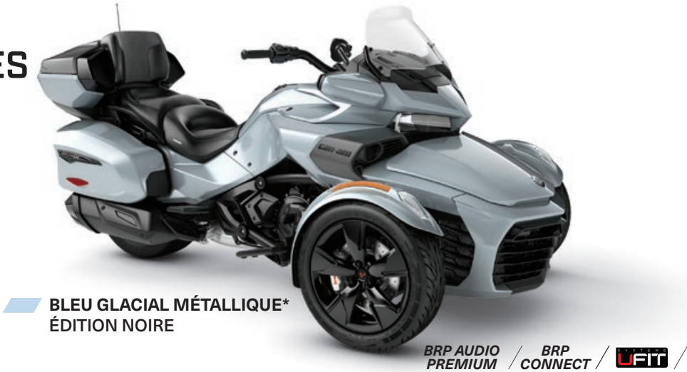
BLEU GLACIAL MÉTALLIQUE* ÉDITION NOIRE