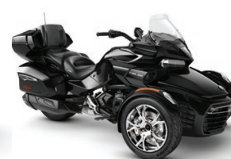
NOIR ACIER MÉTALLIQUE* ÉDITION CHROME