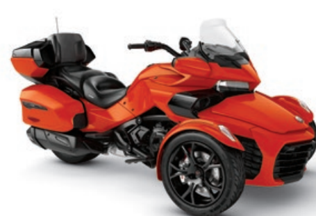
MAGMA ROUGE MÉTALLIQUE* ÉDITION NOIRE