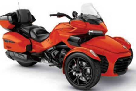
MAGMA ROUGE MÉTALLIQUE* ÉDITION NOIRE