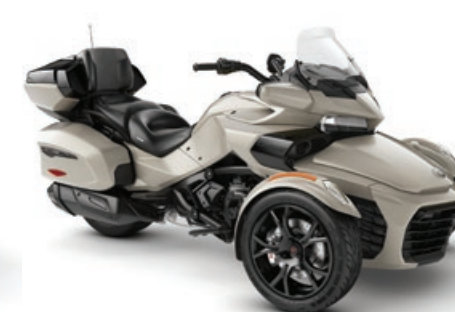
TITANE LIQUIDE* ÉDITION NOIRE