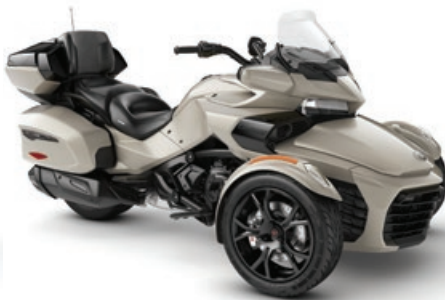
TITANE LIQUIDE* ÉDITION NOIRE