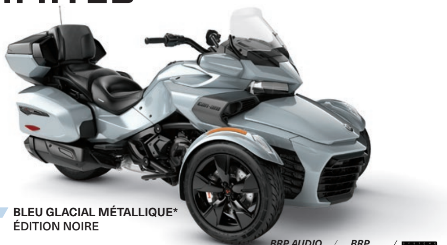
BLEU GLACIAL MÉTALLIQUE* ÉDITION NOIRE

BRP AUDIO PREMIUM / BRP CONNECT / UFIT / ECO