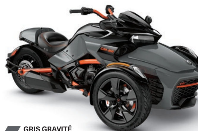
GRIS GRAVITÉ SPECIAL SERIES