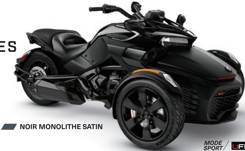
NOIR MONOLITHE SATIN