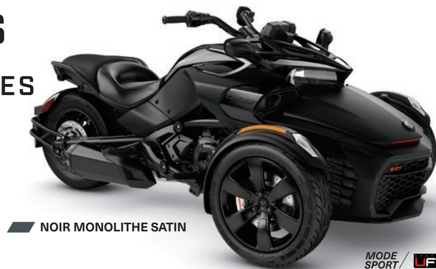
NOIR MONOLITHE SATIN