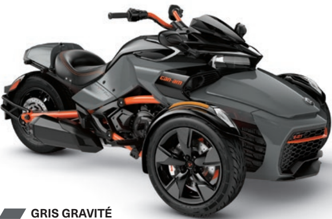
GRIS GRAVITÉ SPECIAL SERIES