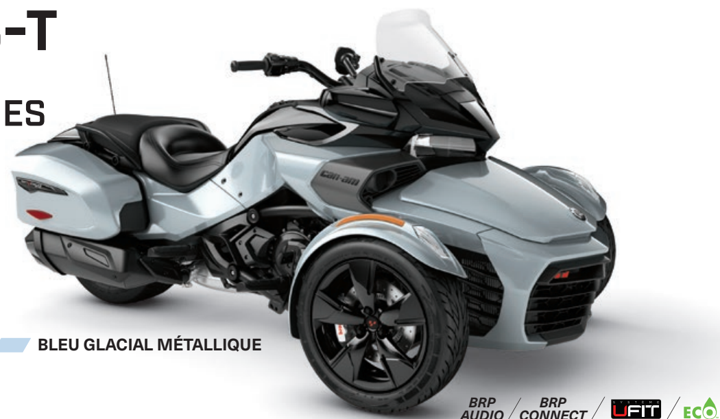
BLEU GLACIAL MÉTALLIQUE