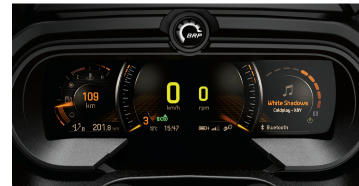
TABLERO DIGITAL Pantalla panorámica LCD a color de 7.8 plg. (19.8 cm) de ancho con BRP Connect que permite la integración de aplicaciones de teléfono inteligente optimizadas para vehículo tales como multimedia, navegación, y otras que se controlan desde el manubrio.