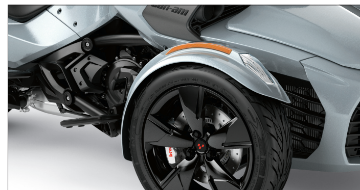
DARK Moderno, rines que destacan la elegancia y dinamismo de la Spyder F3 Limited.