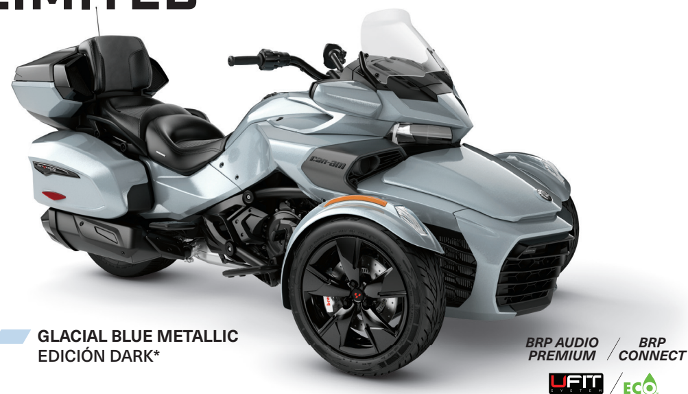
GLACIAL BLUE METALLIC EDICIÓN DARK*

BRP AUDIO PREMIUM / BRP CONNECT LIFT / ECO