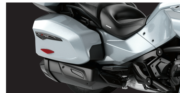
SUSPENSIÓN DE AIRE CON NIVELACIÓN AUTOMÁTICA Los amortiguadores de aire traseros se ajustan automáticamente al peso del pasajero y la carga para garantizar que nunca se comprometa la comodidad.