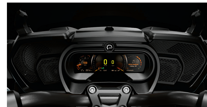
BRP AUDIO PREMIUM Nuestro sistema de sonido de 6 altavoces viene equipado con radio, USB, Bluetooth y entradas de audio de 3.5 mm (1/8 plg.) para que pueda escuchar su música favorita desde cualquier dispositivo.